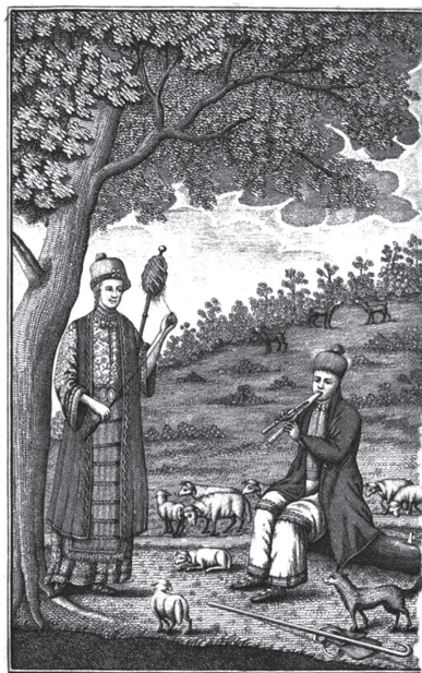
Српска мсла, Или з дсла и зрз