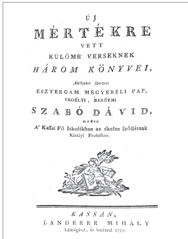
Új mértékre vett külömb versek, 1777

napi, beszélt nyelv kiejtésére. Szabályai összességükben nem térnek el radikálisan a mai magyar időmértékes verselés normáitól, ugyanakkor több ponton sajátos megoldásokat alkalmaz. A hosszú szótag meghatározásakor az n -re végződő ragokat automatikusan hosszúnak tekinti. A rövid szótagok értelmezésében viszont nem fogadja el automatikusan hosszúnak azokat az eseteket, amikor rövid magánhangzóra végződő szó után mássalhangzó-torlódással kezdődő szó következik. Gyakran tekint közösnek szótagokat – talán fogalmazhatunk úgy is, hogy sok esetben támogatja a poetica licentiát . A határozott névelőn kívül felsorol még sok olyan szót, amelyek esetében a szótag tekinthető akár hosszúnak, akár rövidnek (pl. mi, ti, te, ki, is, ha, ne, se, le, -e stb.). Rugalmasan kezeli a latin muta cum liquidat (tehát ha rövid magánhangzó után br, dr, gr, kr, pr, tr, bl, dl, gl, kl, pl, tl következik). Így tekinti a h hangot is, amely a latinban többnyire nem fonéma, nem mindig tekinti teljes értékű mássalhangzónak, hanem szükség szerint né-