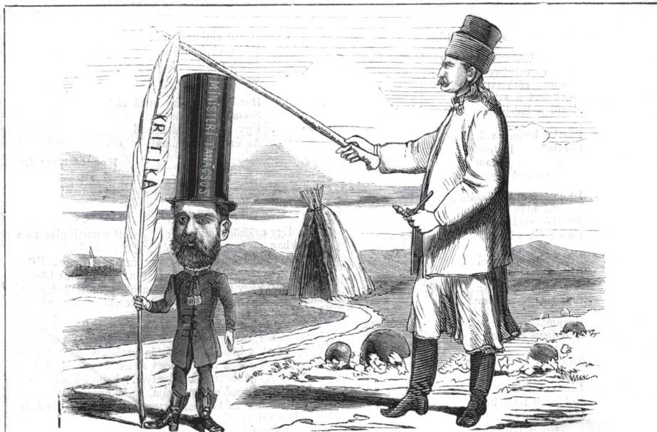
Ni ni ni! az ördögbe, talán még ennyire is kinöhette volna magát.