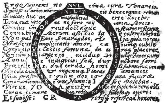
4. Annulus veterum pronubus (1614)

Circulus est veluti teretis sine fine corolla : Nostrum ita perpetuo pectus amore flagret. Ad eundem. Annulus Veterum pronubus. Annulus articulos Sponsi cuiusq, coronat : At vix invenias multis è millibus unum ; Qui sciat, accipiat talis cur pignora doni ? Cur Myste thalamos gemme dignentur honore ?