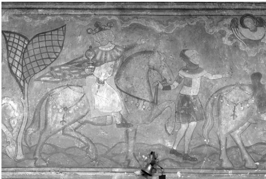
6. kép. Podolin, a második király

király fáradságot nem kímélő, lehetetlent nem ismerő, eleven hitét, amelynek jutalma a célbaérés, az Istennel való találkozás végtelen boldogsága. Mindezt a szereplők lelkiállapotának mélyen expresszív jellemzésével tárja elénk a festő, amelyet fokoz az öltözékek eleven színessége és dekoratív gazdagsága, valamint az alakok életteli dinamikája. A három lovas egyenletes ritmusban követi egymást. Lovaik három egymást követő mozgáshelyzetet jelenítenek meg, a vágatástól a megállásig. A képen ezzel az idő dimenziója is megjelenik, a történések folyamatát a balról jobbra haladó szereplők a heves mozgalmasságtól fokozatosan vezetik a beteljesülés csendjéhez, nyugalmához, a boldogság állandóságához. A célpont, az Istenanya és az Istengyermek ábrázolása, igen tudatosan, éppen az Eucharistiát őrző, a templom falába mélyített szentségház felett jelenik meg: jelzi az Egyház tanítását, hogy a boldogságos Szűz volt a megtestesült Isten első szentségháza. A királyok pompás felvonulását és megérkezésének bemutatását az alatta lévő, a falsík lábuzatát ékesítő festett függöny-ábrázolás is kiemeli.