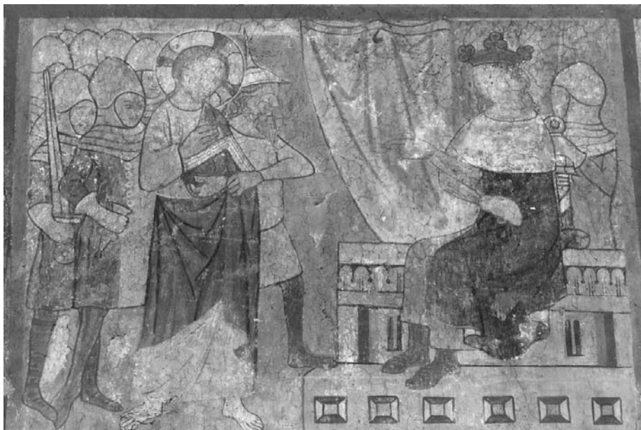
2. kép. Podolin, Jézus Heródes előtt

sióciklust a délkeleti falon a Jézus sírba tétele kép zárta. Ez utóbbiakat már csak Tary Lajos 1912. évi akvarell másolataiból ismerjük. E képsor folytatásában, a déli falon, töredékesen Jézus feltámadása , a Noli me tangere és a Pünkösöd jelenetei ismerhetők fel.