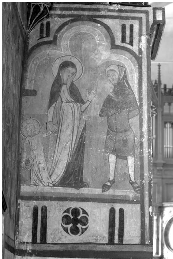
3. kép. Podolin, Szent Dorottya és Teofil

érkezésének is. S ettől kezdve különösen élénk volt a forgalom a két ország között, éppen Podolinon keresztül. 1335-ben a visegrádi kongresszusra érkező uralkodók vonultak át a városon ékes kíséretükkel. Mindezeknek a betetőzése volt 1370-ben a perszónalunió megteremtése a két ország között, Nagy Lajos király lengyel királlyá koronázása, majd a halála után, a lányának, Anjou Hedvignek Lengyelország királynőjévé való választása.