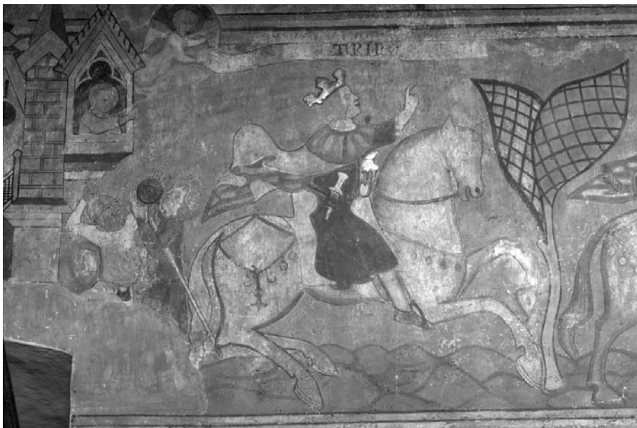
4. kép. Podolin, az angyali üzenet a pásztoroknak és az ifjú király

hogy Podolin fénykora a 17–18. századra lehanyatlott, elvesztette 14. századi, a király számára is kiemelt gazdasági és politikai jelentőségét.